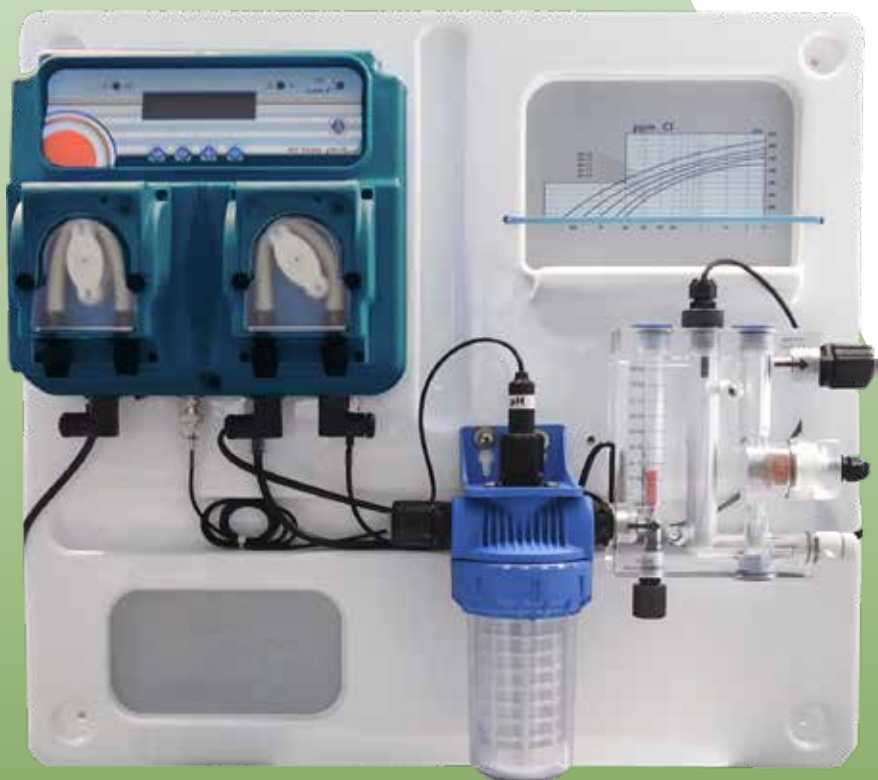
Pannello di dosaggio EASY POOL cloro libero e pH Dosing panel EASY POOL free chlore and pH